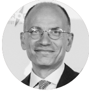
Enrico Letta Président