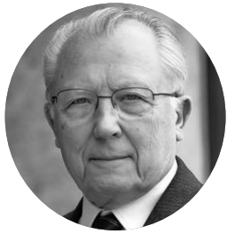
Jacques Delors, Président fondateur