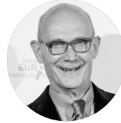
Pascal Lamy Président emeritus